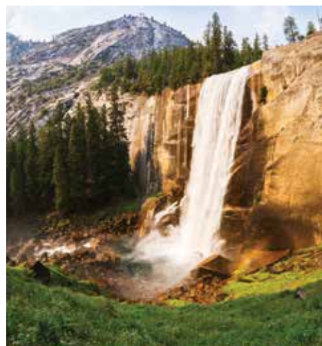
Cataratas Vernal - Yosemite

Abril 5, 19 Mayo 3, 24 Junio 14, 21, 28 Julio 5, 12, 19, 26 Agosto 9, 16 Septiembre 6, 13 Octubre 4, 11 Diciembre 20, 27