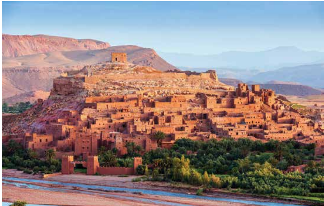
Marruecos - Ouarzazate

Nuestra empresa nació de la necesidad de organizar viajes de larga distancia y ayudar a los que deseaban hacerlo. Pasados 180 años de nuestra fundación, continuamos haciendo todo lo que podemos para ayudarle a conocer aquellos destinos de ensueño.